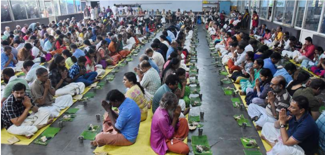
കർക്കിടക വാവ് ദിനമായിരുന്ന ഇന്നലെ പാവക്കുളം മഹാദേവ ക്ഷേത്രത്തിൽ നടന്ന ബലി തർപ്പണം

ആലപ്പുഴ: ചെങ്ങന്നൂർ വനിത ഐ.ടി.ഐയിൽ 2023 വർഷത്തെ അഡ്മിഷനുള്ള അപേക്ഷ തീയതി നീട്ടി. ഡ്രാഫ്റ്റ് സ്മാൻ സിവിൽ, സർവ്വേയർ, ഇലക്ട്രോണിക്സ് മെക്കാനിക്സ്, കമ്പ്യൂട്ടർ ഓപ്പറേറ്റർ ആന്റ് പ്രോഗ്രാമിംഗ് അസിസ്റ്റന്റ്, കമ്പ്യൂട്ടർ ഹാർഡ് വെയർ ആന്റ് നെറ്റ് വർക്ക് മെയിന്റനൻസ്, സ്പെന്റോഗ്രാഫർ ആൻഡ് സെക്രട്ടേറിയൽ അസിസ്റ്റന്റ് (ഇംഗ്ലീഷ്), ഡ്രസ്സ് മേക്കിംഗ് ട്രേഡുകളിലേക്കാണ് അഡ്മിഷൻ നടത്തുന്നത്. ജൂലൈ 20 വൈകിട്ട് അഞ്ചു വരെ അപേക്ഷിക്കാം. അപേക്ഷകൾ www.itiadmissions.kerala.gov.in മുഖേന സമർപ്പിക്കേ ത്തും തൊട്ടടുത്ത സർക്കാർ ഐ.ടി.ഐയിലെത്തി വെരിഫിക്കേഷൻ പൂർത്തിയാക്കേണ്ടതുമാണ്.