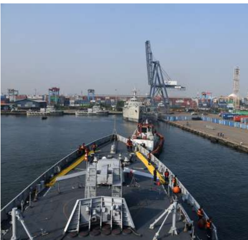
ഡോക്ക് ഷിപ്പ് ബിൽഡേഴ്സ് ലിമിറ്റഡിലാണ് രണ്ട് കപ്പലുകളും നിർമ്മിച്ചിരിക്കുന്നത്.

ന്യൂ ഡൽഹി: തെക്ക് കിഴക്കൻ ഇന്ത്യൻ സമുദ്ര മേഖലയിൽ വിന്യസിച്ചിരിക്കുന്ന ഇന്ത്യൻ നാവികസേനയുടെ രണ്ട് മുൻനിര നാവിക കപ്പലുകളായ ഐഎൻഎസ് സഹ്യദ്രിയം, ഐഎൻഎസ് കൊൽക്കത്ത എന്നിവ ജൂലൈ 17 ന് ജക്കാർത്തയിലെത്തി. കപ്പലുകൾക്ക് ഇന്തോനേഷ്യൻ നാവികസേന ഉഷ്മളമായ സ്വീകരണം നൽകി. പോർട്ട് കോളിനിടെ, ഇരു നാവികസേനകളും തമ്മിലുള്ള പരസ്പര സഹകരണവും ധാരണയും ശക്തിപ്പെടുത്തുന്നതിന് ലക്ഷ്യമിട്ട് ഇന്ത്യൻ, ഇന്തോനേഷ്യൻ നാവികസേനകളിലെ ഉദ്യോഗസ്ഥർ വിപുലമായ പ്രൊഫഷണൽ ഇടപെടലുകൾ, സംയുക്ത യോഗ സെഷനുകൾ, കായിക മത്സരങ്ങൾ, ക്രോസ്വെക്ക് സന്ദർശനങ്ങൾ എന്നിവയിൽ ഏർപ്പെടും. രണ്ട് നാവികസേനകൾക്കിടയിൽ ഇതിനകം നിലനിൽക്കുന്ന ഉയർന്ന അളവിലുള്ള പരസ്പര പ്രവർത്തനക്ഷമത വർദ്ധിപ്പിക്കുന്നതിന് രണ്ട് കപ്പലുകളും ഇൻഡോനേഷ്യൻ നാവികസേനയുമായി കടലിൽ മാരിടൈം പാർട്ണർഷിപ്പ് അഭ്യസനത്തിൽ പങ്കെടുക്കും. ഐഎൻഎസ് സഹ്യദ്രിയം തദ്ദേശീയമായി രൂപകൽപ്പന ചെയ്ത നിർമ്മിച്ച മൂന്നാമത്തെ പ്രോജക്റ്റ് 17 ക്ലാസ് സബ്മറിൻസ് ഫ്രിഗേറ്റാണ്. പ്രോജക്റ്റ് 15 എക്സോസ്റ്റ് തദ്ദേശീയമായി രൂപകൽപ്പന ചെയ്ത നിർമ്മിച്ച ആദ്യത്തെ സബ്മറിൻസ് ഡിസ്ട്രോയറാണ് ഐഎൻഎസ് കൊൽക്കത്ത. മുൻപിലെ മസഗോൺ