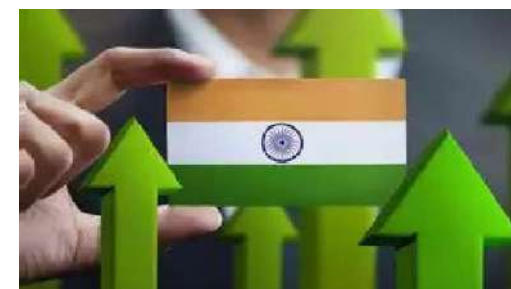
എന്ന് പറയുക. ആഗോഹരി വരുമാനമാകട്ടെ 2030ൽ നാലായിരം ഡോളർ ആയി ഉയരും. 2022ലെ ആഗോഹരി വരുമാനം വെറും 2,450 ഡോളർ മാത്രമാണ്. ഇന്ത്യ ഇതോടെ ഒരു താ

മുംബൈ: ഇന്ത്യയുടെ മൊത്ത ആഭ്യന്തര ഉൽപാദനം അടുത്ത ഏഴ് വർഷം കഴിയുമ്പോൾ 2030ഓടെ ആറ് ലക്ഷം കോടി ഡോളർ ആയി ഉയരുമെന്ന് സ്റ്റാൻഡേഡ് ചാർട്ടേഡ് ബാങ്ക് റിസർച്ച് റിപ്പോർട്ട്. 2023ലെ ജിഡിപി വെറും 3.5 ലക്ഷം കോടി ഡോളർ മാത്രമാണ്. സേവനമേഖലയിൽ ഇന്ത്യയ്ക്ക് കത്തുള്ള മൊത്തം ആഭ്യന്തര ഉൽപാദനത്തെയാണ് ഇന്ത്യയിലെ ജിഡിപി