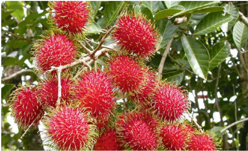
വശ്യമുള്ള അളവിന്റെ 50% ശതമാനം വിളവെടുപ്പ് കഴിഞ്ഞാൽ ഉടനെയും 25% വിളവെടുപ്പിന് 9 ആഴ്ചകൾക്കു ശേഷവും ബാക്കി 25% കായ് പിടിച്ച് 4 ആഴ്ചകൾക്കു ശേഷവും നൽകാം. മരങ്ങൾ തളിർത്തുനിൽക്കുമ്പോൾ വളപ്രയോഗം ഒഴിവാക്കേണ്ടതാണ്.

ശരിയായ വളർച്ചയും ഉൽപാദനവും ഉറപ്പാക്കുന്നതിന് മണ്ണുപരിശോധനയുടെ അടിസ്ഥാനത്തിലുള്ള കൃത്യമായ വളപ്രയോഗം ആവശ്യമുണ്ട്. ഐസിഎആർ ഐഎഫ്എച്ച്ആർ ശുപാർശ പ്രകാരം മരത്തിന്റെ പ്രായം അനുസരിച്ച് ഒരു വർഷം പ്രായമായ ചെടിക്ക് 5 കിലോയും 12 വർഷവും അതിൽ കൂടുതലും പ്രായമുള്ള മരങ്ങൾക്ക് പരമാവധി 25 കിലോയും ജൈവവളങ്ങൾ ഒരു വർഷം നൽകണം. കൂടാതെ 400 ഗ്രാം ഡോളമൈറ്റ്, 435 ഗ്രാം യൂറിയ, 147 ഗ്രാം റോക്ക് ഫോസ്ഫേറ്റ്, 217 ഗ്രാം പൊട്ടാഷ് എന്നിവയും മരത്തിന്റെ പ്രായത്തിന്റെ ഗുണിതങ്ങളായി നൽകണം. ഇപ്രകാരം നൽകുമ്പോൾ 12 വർഷവും അതിനു മുകളിലും പ്രായമായവയ്ക്ക് പരമാവധി 4 കിലോ ഡോളമൈറ്റ്, 5.2 കിലോ യൂറിയ, 1.7 കിലോ റോക്ക് ഫോസ്ഫേറ്റ്, 2.6 കിലോ പൊട്ടാഷ് എന്നിവ ഒരു വർഷം ആവശ്യമുണ്ട്. 4 വർഷം പ്രായമുള്ള മരങ്ങൾക്ക് 3 മാസം ഇടവേളയിൽ ആവശ്യമുള്ള അളവിന്റെ നാലിലൊന്ന് നൽകണം. അഞ്ചാം വർഷം മുതൽ ആ