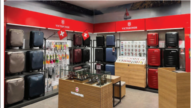
NEW VICTORINOX AT FORUM MALL, MARADU, KOCHI

കൊച്ചി: ഫിഫയുടെ വനിതാ ഫുട്ബോൾ ലക്ഷ്യങ്ങളെ പിന്തുണച്ച്, ഡിയോഡാന്റ് ബ്രാൻഡായ റെക്സോണ കൂടുതൽ പെൺകുട്ടികളെ ഫുട്ബോൾ കളിക്കാൻ സഹായിക്കുക എന്ന ലക്ഷ്യത്തോടെ ഇന്ത്യയിൽ 'ബ്രെക്കിംഗ് ലിമിറ്റ്സ്: ഗേൾസ് ക്യാൻ' സീരീസ് ആരംഭിച്ചു. പ്രസ്ഥാനാധിഷ്ഠിത പ്രോഗ്രാമുകളിലൂടെ യുവാക്കൾക്കിടയിൽ ആത്മവിശ്വാസവും അവസരങ്ങളും വളർത്തുന്നതിന് അവരെ സജ്ജരാക്കുന്നതിലൂടെ പരിശീലകരെയും കമ്മ്യൂണിറ്റി നേതാക്കന്മാരെയും ഉപദേശകരെയും ഉന്നമിപ്പിക്കാൻ ലക്ഷ്യമിട്ടുള്ള ഒരു സൗജന്യ ഡിജിറ്റൽ പരിശീലന പരമ്പരയാണ് റെക്സോണ ബ്രെക്കിംഗ് ലിമിറ്റ്സ് പ്രോഗ്രാമ്. പുതിയ ഗേൾസ് ക്യാൻ സീരീസ് പെൺകുട്ടികൾക്ക് സുരക്ഷിതമായ അന്തരീക്ഷം സൃഷ്ടിക്കുന്നതിനും ആത്മാഭിമാനം വർദ്ധിപ്പിക്കുന്നതിനും എല്ലാ വിഭാഗങ്ങൾക്കുമുള്ള ഉൾപ്പെടുത്തൽ ഉറപ്പാക്കുന്നതിനും ശ്രദ്ധ കേന്ദ്രീകരിക്കുന്നു. യുവതികളായ പെൺകുട്ടികളെ മടികൂടാതെ ഫുട്ബോൾ മൈതാനത്തേക്ക് ചുവടുവെക്കാൻ പ്രചോദിപ്പിക്കുന്നതിന് റെക്സോണ ഇന്ത്യയുമായി സഹകരിക്കുന്നതിൽ അതിയായ സന്തോഷമുണ്ടെന്ന ദേശീയ ഇന്ത്യൻ വനിതാ