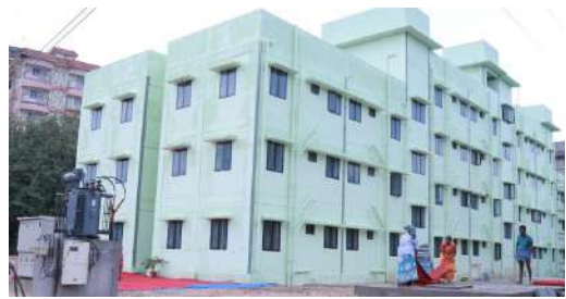
ഡ്ലിംഗ് റൂം റീഡിംഗ് റൂം എന്നിങ്ങനെയുള്ള സൗകര്യങ്ങളും ഉൾപ്പെടുത്തിയിട്ടുണ്ട്.

കൊച്ചി: മുണ്ടംവേലിയിൽ ജിസിഡിഎ ഉടമസ്ഥതയിലുള്ള 70 സെന്റോളം വരുന്ന ഭൂമിയിൽ പ്രീ.എമ്മി.നീ.യേഡ് ബിൽഡിംഗ് സ്കെപ്പർ (പി.എ.ബി) എന്ന നിർമ്മാണരീതിയിൽ രണ്ടു ബ്ലോക്കുകളിലെ നാലു നിലകളിലായാണ് ഭവന സമുച്ചയം യഥാർത്ഥമായിരിക്കുന്നത്. 200 ടൺ സ്റ്റീൽ നിർമ്മാണത്തിനായി ഉപയോഗിച്ചു. കാലങ്ങളായി കനാൽ പുറംമ്പോക്കിൽ ദുരിതപൂർണ്ണമായ ജീവിതം നയിക്കുന്ന 83 കുടുംബങ്ങൾക്ക് പുതിയ വീട് ലഭിക്കുന്നത്. രണ്ട് ബെഡ്റൂം ഒരു ലിവിംഗ് കം ഡൈനിംഗ് റൂം, കിച്ചൻ, ടോയ്ലറ്റ് എന്നിവയുൾപ്പെടെ 375 ചതുരശ്ര അടി വിസ്തീർണമുള്ളതാണ് ഓരോ വീടും. ലൈഫ് മിഷൻ മാർഗ്ഗരേഖ പ്രകാരം കോമൺ അമിനിറ്റിസായി സിങ്ക് റൂം, ഡെ കെയർ സെന്റർ, അ