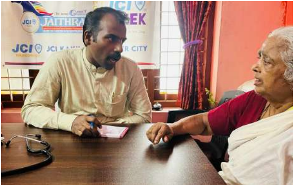
ജെ സി ഐ കാക്കനാട് സൈബർ സിറ്റിയുടെ നേതൃത്വത്തിൽ അമ്മക്കുയിൽ ഓൾഡ് ഏജ് ഹോമിൽ സംഘടിപ്പിച്ച ആരോഗ്യപരിശോധന ക്യാമ്പ്

ഒക്ടോബർ 22ന് രാവിലെ 8 മുതൽ 2 മണിവരെയാണ് ക്ഷേത്രാങ്കണത്തിൽ സംഗീതാർച്ചനയ്ക്ക് അവസരം. 150 രൂപയാണ് രജിസ്ട്രേഷൻ ഫീസ്. (മുദ്രം, വയലിൻ എന്നീ പക്കമേളം) ഉണ്ടായിരിക്കും. പങ്കെടുക്കാൻ താൽപര്യമുള്ളവർ മുൻകൂട്ടി പേര് രജിസ്റ്റർ ചെയ്യണം. കൂടുതൽ വിവരങ്ങൾക്ക് 8714619005, 8547012000 എന്നീ നമ്പരുകളിൽ ബന്ധപ്പെടുക.