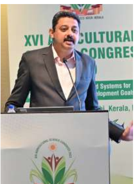
ജനിതക സാങ്കേതികവിദ്യകളുടെയും സാമൂഹികമൂല്യം കൂടി കണക്കിലെടുക്കണം. ഇതിന് എല്ലാ ഘടകങ്ങളും സംയോജി

കൊച്ചി: കാർഷികരംഗത്ത് ജനിതക സാങ്കേതികവിദ്യകൾ കൂടുതൽ ഫലപ്രദമാക്കാൻ സാമൂഹികവശങ്ങൾ കൂടി പരിഗണിക്കുന്നതിനുള്ള സംവിധാനമുണ്ടാകണമെന്ന് വിദഗ്ധർ. കൊച്ചിയിൽ നടക്കുന്ന 16ാമത് അഗ്രികൾച്ചർ സയൻസ് കോൺഗ്രസിൽ ജനിതകസാങ്കേതിക വിദ്യകളുമായി ബന്ധപ്പെട്ട ചർച്ചയിലാണ് അഭിപ്രായം. ജിഎം വിളകളുടെ കാര്യത്തിൽ സാമൂഹികസാമ്പത്തികവശങ്ങൾ കൂടി പരിഗണിച്ചുള്ള നയരൂപീകരണങ്ങൾ ആവശ്യമാണ്. ഈ രംഗത്തെ ഓരോ