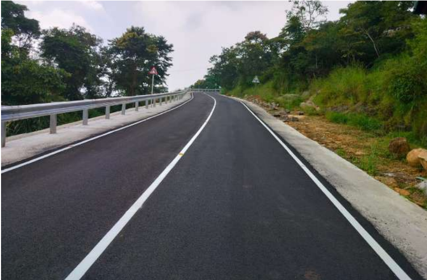
11.19 കോടി രൂപ ചെലവിൽ ബി.എം. ആൻഡ് ബി.സി. നിലവാരത്തിൽ നിർമ്മിച്ച ഇലവീഴാപുഞ്ചിറമേലുകാവ് റോഡ്