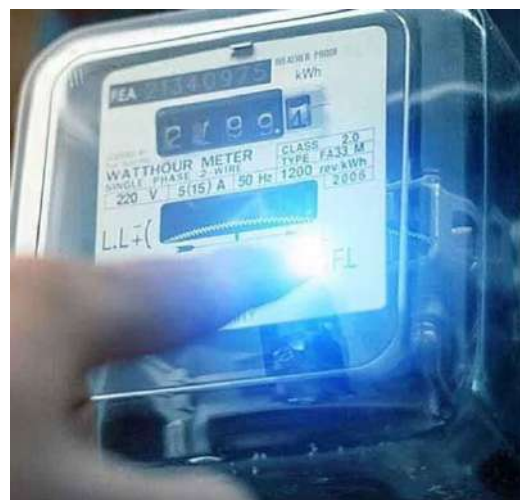
മാസത്തെ ആകെ ബിൽ രൂപയുടെ വർദ്ധന. 40 യൂണിറ്റിൽ ഏകദേശം 100 രൂപയുടെ വർദ്ധന. 200 യൂണിറ്റിൽ താഴെ വൈദ്യുതി

തിരുവനന്തപുരം: ഈ മാസം ഒന്നാം തീയതി മുതൽ മുൻകാല പ്രാബല്യത്തിൽ സംസ്ഥാനത്ത് വൈദ്യുതി നിരക്ക് വർദ്ധിപ്പിക്കാൻ റഗുലേറ്ററി കമ്മീഷൻ ഉത്തരവിറക്കി. ഫിക്സഡ് ചാർജ്ജ് 10 രൂപ മുതൽ 40 രൂപ വരെ വർദ്ധിപ്പിച്ചു. ഇത്തരത്തിൽ വർദ്ധിപ്പിച്ച ഫിക്സഡ് എനർജി ചാർജ്ജുകളുടെ അടിസ്ഥാനത്തിൽ 200 യൂണിറ്റ് വരെ ഉപയോഗിക്കുന്ന വീടുകളിൽ യൂണിറ്റിന് ശരാശരി 20 പൈസ കുട്ടാനാണ് കമ്മീഷന്റെ നിർദ്ദേശം. ഇത്തരത്തിൽ മാസം 200 യൂണിറ്റ് വൈദ്യുതി ഉപയോഗിക്കുന്ന വീടുകളിൽ 48 രൂപയുടെ വർദ്ധനയുണ്ടാകും. 2