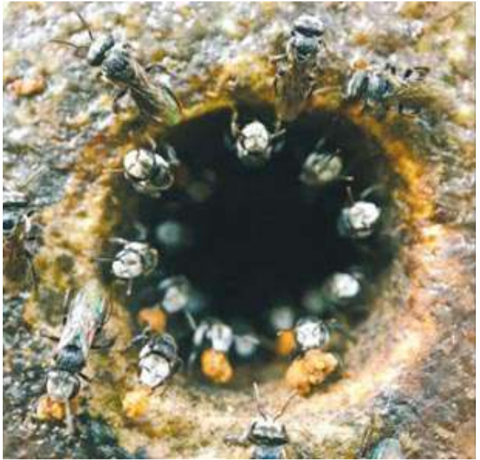
പിയോ കയറോ ഉപയോഗിച്ചു കെട്ടിയാണു കുടാക്കേണ്ടത്. തടിപ്പെട്ടികളും ഇതേപോലെ തന്നെ മുറിച്ചു കുടാക്കി മാറ്റാം. കൂകയും ചെയ്യുന്നതിനു ശ്രദ്ധിക്കണം. കോളനി കൂട്ടം പിരിഞ്ഞു നശിക്കാതിരിക്കാൻ യഥാസമ

ചെറു തേനീച്ചകൾ അടകൾ നിർമ്മിക്കുന്നതു മെഴുകുചെടികളിൽ നിന്നു ശേഖരിക്കുന്ന പശയ്യം (റസിൻ) കൂട്ടിച്ചേർത്തുണ്ടാക്കുന്ന അരക്കുപോലുള്ള മിശ്രിതം കൊണ്ടാണ്. പ്രവേശന കവാടത്തിൽ മെഴുകിൽ മണൽ തരികളോ പൊടികളോ ഒട്ടിച്ചുണ്ടാക്കുന്ന കുഴലുണ്ടാകും. ഇതിനു വിവിധ ആകൃതിയും നീളവുമായിരിക്കും. കുഴലിൻറെ അഗ്രഭാഗത്ത് 56 വേലക്കാരി ഈച്ചകൾ (ഗാർഡ് ബീസ്) കാവലിനുണ്ടാകും.