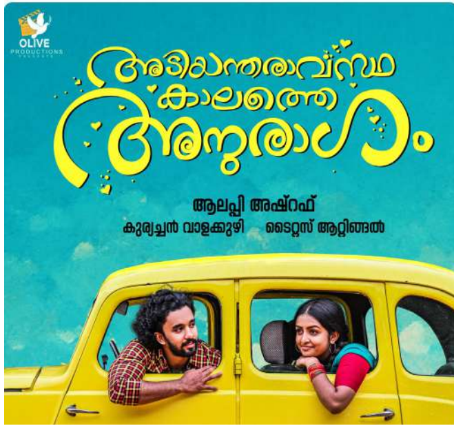
കുറുപ്പാണെന്നും സംവിധായകൻ പറഞ്ഞു. സാധാരണക്കാരായ ഒ