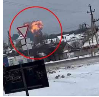
യ്ൻ അതിർത്തിയോടു ചേർന്നുള്ള സതേൺ ബെൽഗോറോദ് പ്രവിശ്യയിലാണ് അപകടമുണ്ടായത്. വിമാന ജീവനക്കാരും യാത്രക്കാരും ഉൾപ്പെടെ വിമാനത്തിലുണ്ടായിരുന്ന 74 പേരും കൊല്ലപ്പെട്ടു.

മോസ്കോ: റഷ്യൻ സൈനിക വിമാനം തകർന്നുണ്ടായ അപകടത്തിൽ എല്ലാവരും കൊല്ലപ്പെട്ടതായി റഷ്യൻ പ്രതിരോധ മന്ത്രാലയം യുക്രെയ്ൻ സൈന്യം വെടിവെച്ചുവീഴ്ത്തിയതാണ് വിമാനം തകരാൻ കാരണമെന്നും റഷ്യ ആരോപിച്ചു. ആകെ 74 പേരാണ് വിമാനത്തിൽ ഉണ്ടായിരുന്നത്. ഇതിൽ 65 പേർ യുക്രെയ്നിൽനിന്നുള്ള യുദ്ധത്തടവുകാരാണ്. ഇവരെ കൈമാറാൻ കൊണ്ടുപോയപ്പോഴായിരുന്നു സംഭവം. അതേസമയം, റഷ്യയുടെ ആരോപണത്തെ തള്ളാനോ പ്രതിരോധിക്കാനോ ഈ ഘട്ടത്തിൽ യുക്രെയ്ൻ തയ്യാറായിട്ടില്ല. റഷ്യ യുക്രെയ്ൻ യുദ്ധം 700 ദിവസത്തിലേത്തിനിൽക്കുമ്പോൾ ഇരുകൂട്ടരും കൂടുതൽ വിവരങ്ങൾ പുറത്തുവിടാതിരിക്കാനാണ് ശ്രമിക്കുന്നത്. യുക്രെയ്ൻ അതിർത്തിയോടു ചേർന്നുള്ള സതേൺ ബെൽഗോറോദ് പ്രവിശ്യയിലാണ് അപകടമുണ്ടായത്. വിമാന ജീവനക്കാരും യാത്രക്കാരും ഉൾപ്പെടെ വിമാനത്തിലുണ്ടായിരുന്ന 74 പേരും കൊല്ലപ്പെട്ടു.