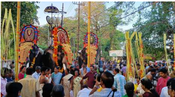
പൊന്നൂരുന്നി ശ്രീനാരായണശോഭം ക്ഷേത്രത്തിലെ ഉൽസവത്തോടനുബന്ധിച്ചു നടന്ന പകൽപ്പരം.