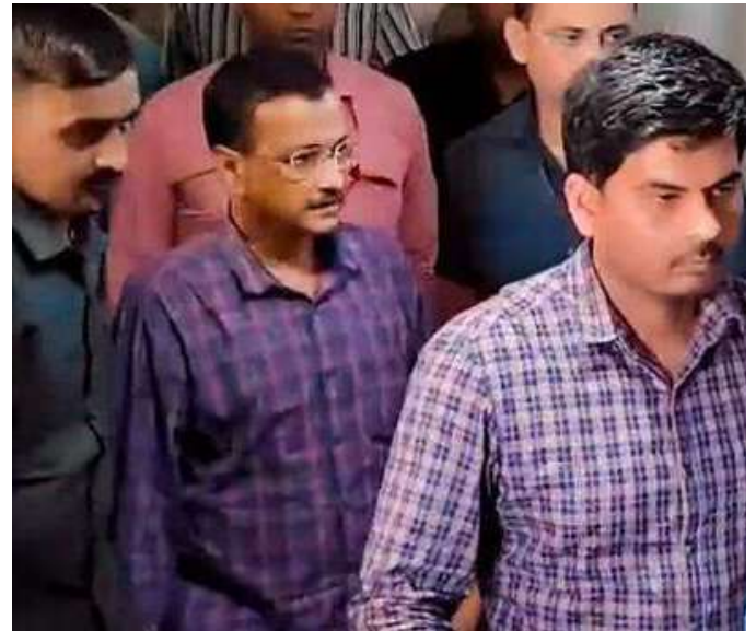
വിദേശകാര്യ വക്താവ് മാത്യു മില്ലറുടെ പ്രസ്താവന.

നിയമ നടപടികൾ സുതാര്യവും നിഷ്പക്ഷവും സമയബന്ധിതവുമായ കണമെന്നുമായിരുന്നു അമേരിക്കൻ