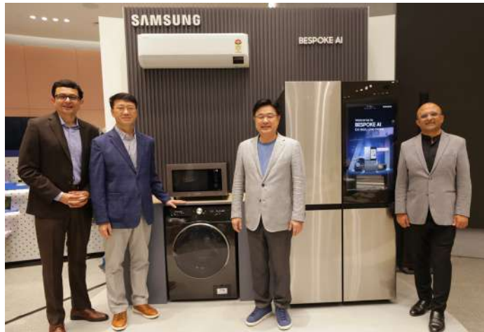
എ അവതരിപ്പിക്കുകയാണെന്നും ഇത് ഇന്ത്യൻ വീടുകൾക്ക് ഏറെ ഗുണകരമാണെന്നും സാംസങ് സൗ

കൊച്ചി: ഇന്ത്യയിലെ ഏറ്റവും പ്രമുഖ ഇലക്ട്രോണിക് ബ്രാൻഡായ സാംസങ് ആർട്ടിഫിഷ്യൽ ഇന്റലിജൻസ് സാങ്കേതിക തന്മിയുള്ള ബെസ് പോക്ക് ഗൃഹോപകരണങ്ങൾ അവതരിപ്പിച്ചു. അതിവേഗം വളരുന്ന പ്രീമിയം ഗൃഹോപകരണങ്ങളുടെ വിപണിയിൽ ഉപഭോക്താക്കളുടെ പ്രതീക്ഷകളെക്കൊപ്പം വളരുകയാണ് സാംസങ്ങിന്റെ ലക്ഷ്യം. വൈഫൈ, ക്യാമറകൾ, എഐ ചിപ്പുകൾ എന്നിവയടങ്ങുന്ന സാംസങ്ങിന്റെ അതിനൂതന സാങ്കേതിക മികവുള്ള ഉപകരണങ്ങൾ സാമാർത്ഥ് തിംഗ്സ് ആപ്ലിക്കേഷനിലൂടെ എളുപ്പത്തിൽ കൈകാര്യം ചെയ്യാനും നിയന്ത്രിക്കാനും സാധിക്കുന്ന സൗകര്യപ്രദമായ ഹോം മാനേജ്മെന്റ് സാധ്യമാക്കുന്നു. ഗൃഹോപകരണരംഗത്ത് ആർട്ടിഫിഷ്യൽ ഇന്റലിജൻസ് ഉപയോഗിച്ചുള്ള ഏറ്റവും മികച്ച അതിനൂതന ബെസ് പോക്ക് എ