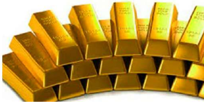
ഭിച്യ 2022ന് ശേഷമാണ് റിസർവ് ബാങ്ക് വിദേശത്ത് സൂക്ഷിച്ചിരുന്ന സ്വർണം നാട്ടിലേക്ക് കൊണ്ടുവരാൻ തുടങ്ങിയത്. യുദ്ധത്തിന്റെ പശ്ചാത്തലത്തിൽ റഷ്യയുടെ വിദേശ നാണയ ശേഖരം അമേരിക്ക

കൊച്ചി: വിദേശത്ത് സൂക്ഷിക്കുന്ന സ്വർണത്തിന്റെ അളവ് റിസർവ് ബാങ്ക് കുത്തനെ കുറയ്ക്കുന്നു. ആഭ്യന്തര സ്വർണ ശേഖരം കുത്തനെ വർദ്ധിപ്പിക്കാൻ ലക്ഷ്യമിട്ട് വിദേശത്ത് നിന്നും സ്വർണം ഇന്ത്യയിലേക്ക് മടക്കി കൊണ്ടുവരുന്നതിനാണ് റിസർവ് ബാങ്ക് ശ്രദ്ധയൂന്നുന്നത്. കഴിഞ്ഞ മാസം യുകെയിൽ നിന്ന് 100 ടൺ സ്വർണം റിസർവ് ബാങ്ക് ഇന്ത്യയിലേക്ക് കൊണ്ടുവന്നിരുന്നു. നിലവിൽ മൊത്തം സ്വർണ ശേഖരത്തിന്റെ 47 ശതമാനം മാത്രമാണ് വിദേശത്തുള്ളത്. റഷ്യയും യുകെയ്നുമായുള്ള യുദ്ധം ആരം