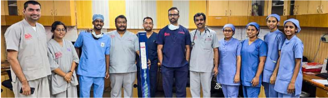
ചികിത്സക്ക് നേതൃത്വം നൽകിയ ഡോക്ടർമാരും സ്റ്റാഫ് അംഗങ്ങളും.