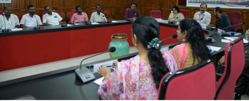
വിവിധ ഗവേഷണഫലങ്ങൾ മത്സ്യത്തൊഴിലാളികളുമായും മറ്റ് അനുബന്ധമേഖലകളിൽ പ്രവർത്തിക്കുന്നവരുമായി ചർച്ച ചെയ്യുന്നതിന് സിഎംഎഫ്ആർഐ സംഘടിപ്പിച്ച ശില്പശാല