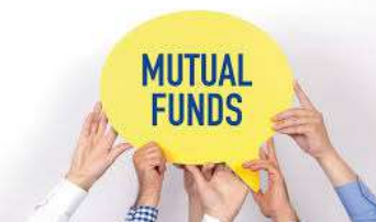
ബാങ്കുകളിലാണ് സൂക്ഷിച്ചിരുന്നത്. എന്നാൽ ഓഹരി വിപണിയുടെ വളർച്ചയും നിക്ഷേപിക്കാനുള്ള എളുപ്പവും ധാരാളം ആളുകളെ സ്ട്രോക്ക് മാർക്കറ്റിലേക്കും മുച്ഛാൽ

ന്യൂഡൽഹി: ജനങ്ങൾ ബാങ്ക് നിക്ഷേപങ്ങളിൽ നിന്ന് അകലുന്നതിൽ ആശങ്ക പ്രകടിപ്പിച്ച് റിസർവ് ബാങ്ക് ഗവർണർ ശക്തികാന്തദാസ്. ബാങ്കുകളിലെ സേവിങ് നിക്ഷേപങ്ങൾ ഉൾപ്പെടെയുള്ള പരമ്പരാഗത മാർഗങ്ങളിൽ നിന്ന് നിക്ഷേപകർ അകലുന്നത് രാജ്യത്ത് ലിക്വിഡിറ്റി പ്രശ്നങ്ങളുണ്ടാക്കുമെന്നതാണ് പ്രധാന ആശങ്ക. അടുത്തകാലത്തായി മുച്ഛാൽ ഫണ്ടുകളിലേക്കും മറ്റ് സാമ്പത്തിക ഉൽപ്പന്നങ്ങളിലേക്കുമാണ് നിക്ഷേപങ്ങൾ പോകുന്നത്. മുൻകാലങ്ങളിൽ കുടുംബങ്ങളും വ്യക്തികളും അവരുടെ നിക്ഷേപങ്ങൾ