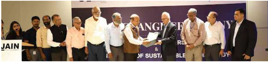
കൊച്ചി ജെയിൻ യൂണിവേഴ്സിറ്റിയും ഗുജറാത്തിലെ യുപിഎൽ യൂണിവേഴ്സിറ്റി ഓഫ് സസ്റ്റൈനബിൾ ടെക്നോളജിയും ധാരണാപത്രം കൈമാറുന്നു