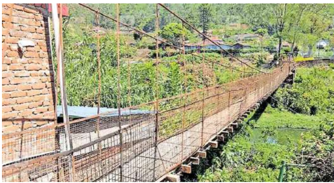
രിട്ട പാലമാണിത്. ചൊക്കനാട്, പഴയ മൂന്നാർ, ഹൈറേഞ്ച് ക്ലബ്ബ് എന്നീ ഭാഗങ്ങളിൽ നിന്നുള്ള തൊഴിലാളികൾ വിവിധ ആവശ്യങ്ങൾക്കായി മൂന്നാറിലേക്ക് ഇതു വഴിയായിരുന്നു യാത്ര ചെയ്തിരുന്നത്. പാലം തകർന്നതോടെ ഓട്ടോയിൽ 5 കിലോമീറ്റർ ചുറ്റി സഞ്ചരിച്ചാണ് നിലവിൽ ആളുകൾ യാത്ര ചെയ്യുന്നത്. നാട്ടുകാരുടെ പരാതികളെ തുടർന്നാണ് 3 വർഷം മുൻപ് എം എൽഎയുടെ പ്രാദേശിക ആസ്തി വികസന ഫണ്ടിൽ നിന്നു തുക അനുവദിച്ചത്.