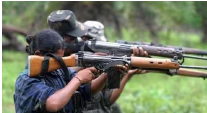
രച്ചിലിലാണ് മൃതദേഹങ്ങൾ കണ്ടെടുത്തത്. മാവോയിസ്റ്റ് സംഘം ഉപയോഗിച്ചിരുന്ന ആയുധശേഖരവും കണ്ടെത്തി.

റായ്പൂർ: ഛത്തീസ്ഗഡിലെ നാറായൺപൂർ, ദന്തേവാഡ അതിർത്തിയിൽ നടന്ന ഏറ്റുമുട്ടലിൽ 30 മാവോയിസ്റ്റുകളെ സുരക്ഷാ ഉദ്യോഗസ്ഥർ വധിച്ചു. മൃതദേഹങ്ങൾ തിരിച്ചറിഞ്ഞിട്ടില്ല. സംഘർഷ സാധ്യത നിലനിൽക്കുന്നതിനാൽ പൊലീസും സിആർപിഎഫ് ഉദ്യോഗസ്ഥരും വനമേഖലയിൽ തുടരുകയാണ്.