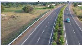
പുറം അരുർതുറവൂർ റോഡും കുനളങ്ങി റോഡും ഗതാഗത തടസം

തുടരുകയാണ്. നിലവിൽ എറണാകുളത്തുനിന്നുവരുന്ന വാഹനങ്ങളും ആലപ്പുഴ ഭാഗത്തുനിന്ന് വരുന്ന വാഹനങ്ങളും മണിക്കൂറുകളായി വഴിയിൽ കുടുങ്ങി കിടക്കുന്നുണ്ട്. മണിക്കൂറുകൾ അടുത്താണ് വാഹനങ്ങൾ ഒരു പോയിന്റ് പിന്നിടുന്നത്. ദേശീയപാതയോടൊ