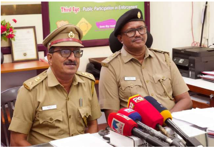
ഈ ആർ ടി ഒ പറഞ്ഞു. വെറ്റിലയിലെയും കാക്കനാട് ജംഗ്ഷനിലെയും ഗതാഗതക്കുരുക്ക് പരിഹരിക്കുന്നതിനുള്ള നിർദ്ദേശങ്ങൾ സമർപ്പിച്ചിട്ടുണ്ട്. നഗരത്തിൽ മത്സരയോട്ടം നടത്തുന്ന ബസുകൾക്കെതിരേ നടപടി കർശനമാക്കും. വിലകൂടിയ ആഡംബര ബൈക്കുകൾ അമിത വേഗത്തിൽ ഓടിക്കുന്നവർക്കെതിരേ നടപടി സ്വീകരിക്കുന്നുണ്ട്. നേരത്തേ പരീക്ഷണാടിസ്ഥാനത്തിൽ കളമശേരി എച്ച് എം ടി ജംഗ്ഷനിൽ ആരംഭിച്ച ഗതാഗതക്രമീകരണം സ്ഥിരമാക്കും.