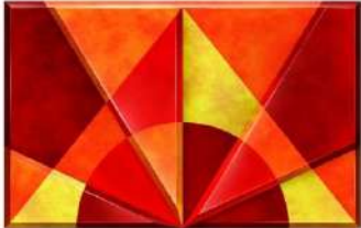
ADITYA BIRLA GROUP