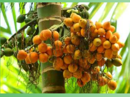
റബ്ബറിന് ഇടവിളയാക്കിയവരും പൂർണ്ണമായി കവുങ്ങ് മാത്രം കൃഷിചെയ്തവരും നിരവധിയാണ്. തോട്ടങ്ങളുടെ അതിരുകളിലും കവുങ്ങുകൾ സ്ഥാനം പിടിച്ചു. ഉണങ്ങിയ കൊട്ടപ്പാക്കിന് 300310 രൂ

വില എത്ര ഇടിഞ്ഞാലും റബ്ബറിന് പകരക്കാരായി മറ്റൊരു വിളയെ കണ്ടെത്തുക ഏറെ പ്രയാസമുള്ള കാര്യമാണ്. ആ പ്രവണതയ്ക്ക് മാറ്റംവരുത്തി കവുങ്ങ് മടങ്ങിവരുന്നു. ഇടക്കാലത്ത് കൊക്കോയും, കാപ്പിയുമൊക്കെ പരീക്ഷിച്ചെങ്കിലും ഉള്ളിൽ മെച്ചം കവുങ്ങാണെന്ന് ഭൂരിഭാഗം കർഷകരും തിരിച്ചറിഞ്ഞു. ചുരുങ്ങിയ കാലത്തിനുള്ളിൽ വിളവെടുക്കാം, ഒപ്പം റബ്ബറിനേക്കാൾ ഇരട്ടി വിലയും. അധാനവും പരിചരണച്ചെലവും നാലിലൊന്ന് മാത്രം. ജില്ലയുടെ കിഴക്കൻ മേഖലകളിലും കാഞ്ഞിരപ്പള്ളി, മുണ്ടക്കയം, കുട്ടിക്കൽ, ഏന്തയാർ മേഖലകളിലും റബ്ബർ പൂർണ്ണമായി വെട്ടിമാറ്റി കവുങ്ങ് കൃഷിയിലേക്ക് മാറിയ നിരവധി കർഷകരാണുള്ളത്.