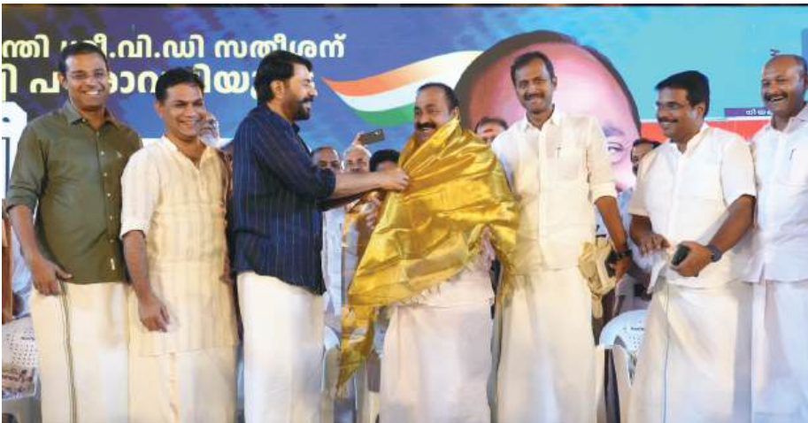
കൊച്ചിയിൽ പൗരാവലി ഒരുക്കിയ സ്വീകരണത്തിൽ മുഖ്യമന്ത്രി വി.ഡി സതീശനെ ചലച്ചിത്ര താരം മമ്മൂട്ടി പൊന്നാടയണിയിച്ച് ആദരിച്ചപ്പോൾ.

കൊച്ചി: കേരളത്തിന്റെ സമ്പദ്വ്യവസ്ഥയെയും ജനജീവിതത്തെയും ഉയർത്തുന്ന സ്വപ്നതുല്യമായ വികസന പദ്ധതികൾ യഥാർത്ഥ്യമാക്കുമെന്ന് മുഖ്യമന്ത്രി വി.ഡി സതീശൻ. കൊച്ചിയിൽ പൗരാവലി ഒരുക്കിയ സ്വീകരണം ഏറ്റെടുക്കാനാണ് സംസ്ഥാനി കുറയായിരുന്നു അദ്ദേഹം. കേവലം കുറ്റൻ കെട്ടിടങ്ങളും നിർമ്മിതികളും ഉയരുന്നതല്ല വികസനം. സാധാരണ ജനങ്ങളുടെ ജീവിതനിലവാരത്തിൽ ഉണ്ടാകുന്ന പുരോഗമന പരമായ മാറ്റമാണ് യഥാർത്ഥ വികസനം. വെല്ലുവിളികൾ ഏറെ ഉണ്ടെങ്കിലും അതിനെയെല്ലാം അതിജീവിച്ച് കേരളത്തെ മാറ്റിയെടുക്കാനുള്ള കൃത്യമായ കാഴ്ചപ്പാട് പുതിയ സർക്കാരിനുണ്ടെന്നും മുഖ്യമന്ത്രി പറഞ്ഞു. താൻ ധനകാര്യ വകുപ്പ് ഏറ്റെടുത്തത് മറ്റൊന്നും കെണ്ടല്ല, അതൊരു ചലഞ്ചാണ് നന്നും മുഖ്യമന്ത്രി പറഞ്ഞു. സംസ്ഥാനത്തിന്റെ സമ്പദ്വ്യവസ്ഥയെ മെച്ചപ്പെടുത്തുകയാണ് പ്രധാന ലക്ഷ്യം. ഖജനാവും സമ്പത്തും ജനങ്ങളുടേതാണ്. അതുകൊണ്ട് വികസനത്തിലൂടെ ഉണ്ടാകുന്ന സമ്പത്ത് സമൂഹത്തിലെ എല്ലാ വിഭാഗം ജനങ്ങളിലേക്കും നീതിപൂർവ്വമായി വിതരണം ചെയ്യും. കേരളത്തെ തുറമുഖ ഏവിയേഷൻ ഹബ്ബുകൾ ആക്കി മാറ്റുക എന്ന് ഉൾപ്പെടെയുള്ള സ്വപ്ന പദ്ധതികൾ പലതും സംസ്ഥാനത്ത് യഥാർത്ഥ്യമാകും. വരുന്ന സംസ്ഥാന ബഡ്ജറ്റിൽ ആരോഗ്യ വിദ്യാഭ്യാസ അടിസ്ഥാന