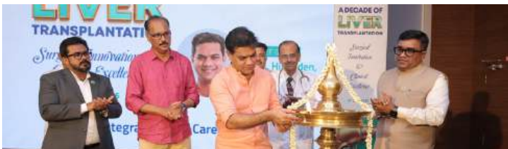
ആസ്റ്റർ മെഡ്സിറ്റിയിലെ കരൾ മാറ്റിവെക്കൽ ശസ്ത്രക്രിയയുടെ പത്താം വാർഷിക ആഘോഷചടങ്ങിന്റെ ഉദ്ഘാടനം ഹൈബി ഊഡൻ എം.പി. നിർവ്വഹിക്കുന്നു.

കൊച്ചി: കുട്ടികൾക്കും മുതിർന്നവർക്കുമുള്ള കേരളത്തിലെ ഏറ്റവും വലുതും സമഗ്രവുമായ ട്രാൻസ്പ്ലാന്റ് സെന്ററുകളിലൊന്നായ ആസ്റ്റർ മെഡ്സിറ്റിയിലെ ഇന്റഗ്രേറ്റഡ് ലിവർ കെയർ വിഭാഗം 640-ൽ പരം കരൾ മാറ്റിവെക്കൽ ശസ്ത്രക്രിയകൾ വിജയകരമായി നടത്തി ഒപ്പം പത്താം വാർഷികവും ആഘോഷിച്ചു. പത്താം വാർഷികത്തിന്റെ ഉദ്ഘാടനം ഹൈബി ഊഡൻ എം.പി. നിർവ്വഹിച്ചു. 'ആരോഗ്യത്തിന്റെയും പ്രത്യാശയുടെയും മികച്ചൊരു പാഠവര്യം കെട്ടിപ്പടുക്കാൻ ഒന്നിച്ച പ്രവർത്തിച്ച രോഗികൾ, അവരുടെ കുടുംബങ്ങൾ, ആരോഗ്യ പ്രവർത്തകർ എന്നിവരടങ്ങുന്ന സമൂഹത്തിന്റേതാണ് ഈ പത്തു വർഷത്തെ നാഴികക്കല്ലെന്ന് ആസ്റ്റർ മെഡ്സിറ്റിയിലെ ഹെൽപ്പറ്റോ പാൻക്രിയാറ്റോ ബിലിയറി & അ