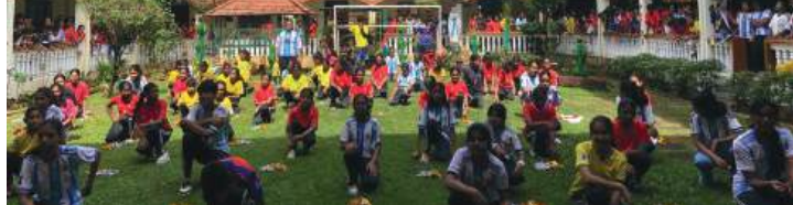
തൈസേ സ്പിനെയി പബ്ലിക് സ്കൂളിലെ കുട്ടികൾ വിവിധരാജ്യങ്ങളുടെ ജേഴ്സി അണിഞ്ഞ് അണിനിരന്നപ്പോൾ

കലൂർ: 2026 ഫിഫ ലോകകപ്പിന്റെ ആഘോഷങ്ങൾ വർണ്ണാഭമാക്കുവാൻ പൊറ്റക്കുഴി തൈസേ സ്പിനെയി പബ്ലിക് സ്കൂളിലെ കായിക പ്രേമികൾ അണിനിരന്നു. തങ്ങളുടെ പ്രിയപ്പെട്ട രാജ്യങ്ങളുടെ ജേഴ്സി അണിഞ്ഞാണ് വിദ്യാർത്ഥികളും അധ്യാപകരും സ്കൂളിലേക്ക് എത്തിയത്. പ്രമുഖ താരങ്ങളുടെ കട്ടൗട്ടുകളും ഓരോ രാജ്യത്തിന്റെയും പതാകകളും കൊണ്ട് സ്കൂൾ അങ്കണം വർണ്ണാഭമാക്കി. ഫിഫയുടെ തീം സോങ്ങിന് അനുസരിച്ച് വിദ്യാർത്ഥികൾ നൃത്തച്ചുവടുകൾ വച്ചു. ആഘോഷത്തിന്റെ ഭാഗമായി പെനാൽറ്റി ഷൂട്ടൗട്ട്