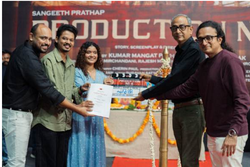
കഎഎക്, കഎഎഗ് ചലച്ചിത്രമേളകളിലേക്ക് തിരഞ്ഞെടുക്കപ്പെടുകയും പ്രേക്ഷകരുടെയും നിരൂപകരുടെയും മുക്തകണ്ഠമായ പ്രശംസ നേടുകയും ചെയ്തിരുന്നു.