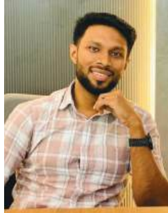
ഡോ. ആഷിഖ്. എമർജൻസ് ഹോമിയോ പ്ലതി അവാർഡ്