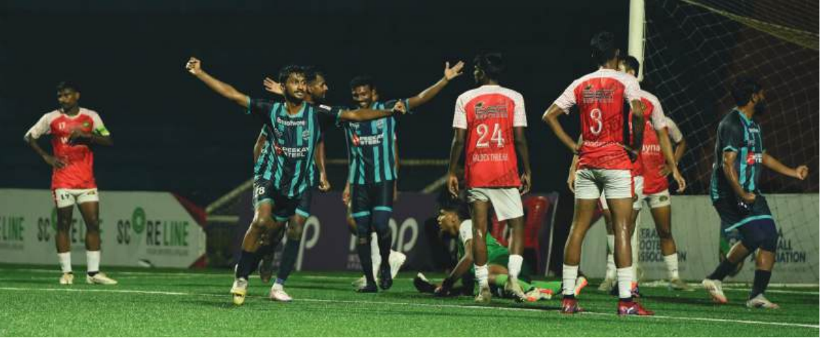
ഗോൾഡൻ ട്രെയ്സിനെതിരായ മത്സരത്തിൽ വിജയ ഗോൾ ആഘോഷിക്കുന്ന കാലിക്കറ്റ് എഫ്സി താരങ്ങൾ.