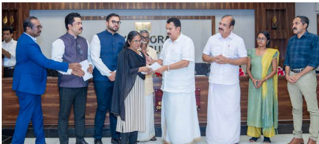
മുണ്ടത്തിക്കോട് വെടിപ്പെട്ട് അപകടത്തിൽ പെട്ടവർക്ക് എം എ യുസഫലി പ്രഖ്യാപിച്ച സഹായധനം മരണപ്പെട്ടവരുടെ ആശ്രിതർക്ക് മന്ത്രി കെ മുരളീധരൻ കൈമാറുന്നു.

അടൽ ബിഹാരി വാജ്പേയി കൗശല്യ വികാസ് കേന്ദ്രയിലെ വിദ്യാർത്ഥികളെ പിന്തുണയ്ക്കുന്നതിലൂടെ പോഷകാഹാരം, പഠനം, ഉപജീവന അവസരങ്ങൾ എന്നിവ സമന്വയിപ്പിക്കുന്ന പൊതുവായ പ്രതിബദ്ധതയെയാണ് മലബാർ ഗ്രൂപ്പ് പ്രതിഫലിപ്പിക്കുന്നത്. പട്ടിണി നിർമ്മാർജ്ജനം, ആരോഗ്യ സംരക്ഷണം, വിദ്യാഭ്യാസം, സ്ത്രീശാക്തീകരണം, ഭവന നിർമ്മാണം, പരിസ്ഥിതി സംരക്ഷണം തുടങ്ങിയ മേഖലകളിലാണ് മലബാർ ഗ്രൂപ്പിന്റെ സി എസ് ആർ പ്രവർത്തനങ്ങൾ പ്രധാനമായും നടപ്പാക്കുന്നത്. സി എസ് ആർ പ്രവർത്തനങ്ങളിലൂടെ സമൂഹത്തിൽ വ്യവസ്ഥാപിതവും ദീർഘകാലാടിസ്ഥാനത്തിലുള്ളതുമായ മാറ്റങ്ങൾ സൃഷ്ടിക്കാൻ മലബാർ ഗ്രൂപ്പിന് സാധിക്കുന്നുണ്ട്.