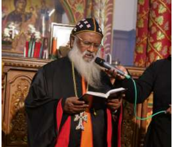
കാർ മനസുമാണ് ക്ഷമിക്കുന്നതിൽ നിന്ന് നമ്മെ തടയുന്നത്. ആ ചിന്ത

കോട്ടയം: സത്യ അനുതാപത്തിൻ്റെ കാലമാണ് വലിയ നോമ്പെന്ന് മലങ്കര ഓർത്തഡോക്സ് സഭാധ്യക്ഷൻ പരിശുദ്ധ ബസേലിയോസ് മാർത്തോമ്മാ മാത്യൂസ് തൃതീയൻ കാതോലിക്കാബാവ. നോമ്പിലേക്കുള്ള ഒരുക്കമാണ് ശുബ്കോനോ ശുശ്രൂഷ. ശുബ്കോനോ എന്നാൽ ക്ഷമ എന്നാണ് അർത്ഥം. വലിയ നോമ്പിൻ്റെ പരിപാവന ദിനങ്ങളിൽ ക്ഷമിക്കാനും, മറക്കാനും കഴിയണം. പരസ്പരം ക്ഷമിച്ച് സ്നേഹവും, സമാധാനവും കൈവരിക്കണം. നാം ആരോട് ക്ഷമിക്കുന്നുവോ അവരുടെ നന്മക്ക് വേണ്ടി പ്രാർത്ഥിക്കണം. സ്വാർത്ഥതയും, അഹ