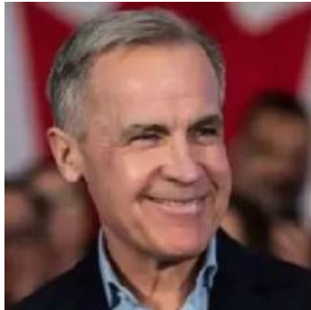
രിലെ 17 മന്ത്രിമാരെ ഒഴിവാക്കിയിട്ടുണ്ട്. രണ്ട് ഇന്ത്യൻ വംശജരും മന്ത്രിസഭയിലുണ്ട്. അനിത ആനന്ദ് മിനി

ഒട്ടോവാ: കാനഡയുടെ ഇരുപത്തിനാലാം പ്രധാനമന്ത്രിയായി അധികാരമേറ്റ് മാർക്ക് കാർണി. ജസ്റ്റിൻ ട്രൂഡോ ഔദ്യോഗികമായി രാജി സമർപ്പിച്ചതിന് പിന്നാലെയാണ് മാർക്ക് കാർണി അധികാരമേറ്റ്. ഒട്ടാവയിലെ പാർലമെന്റ് സമുച്ചയത്തിൽ നടന്ന സ്ഥാനാരോഹണ ചടങ്ങിൽ വർണൻ ജനറൽ മേരി സൈമൺ അധ്യക്ഷത വഹിച്ചു. മുൻ പ്രധാനമന്ത്രി മാർ, ഗവർണർ ജനറൽമാർ തുടങ്ങി രാജ്യത്തെ പ്രമുഖ രാഷ്ട്രീയ നേതാക്കളും ചടങ്ങിൽ പങ്കെടുത്തു. എന്നാൽ രാജിവച്ച ജസ്റ്റിൻ ട്രൂഡോ ചടങ്ങിന് എത്തിയിരുന്നില്ല. കാർണി മന്ത്രിസഭയിൽ 24 അംഗങ്ങളാണുള്ളത്. ട്രൂഡോ സർക്കാ