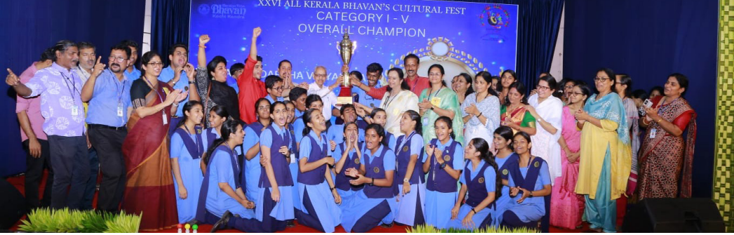
26 മത് അഖില കേരള ഭവൻസ് കലോത്സവം ഓവറോൾ ചാമ്പ്യൻഷിപ്പ് ട്രോഫി കരസ്ഥമാക്കി കാക്കനാട് ഭവൻസ് ആദർശ വിദ്യാലയം