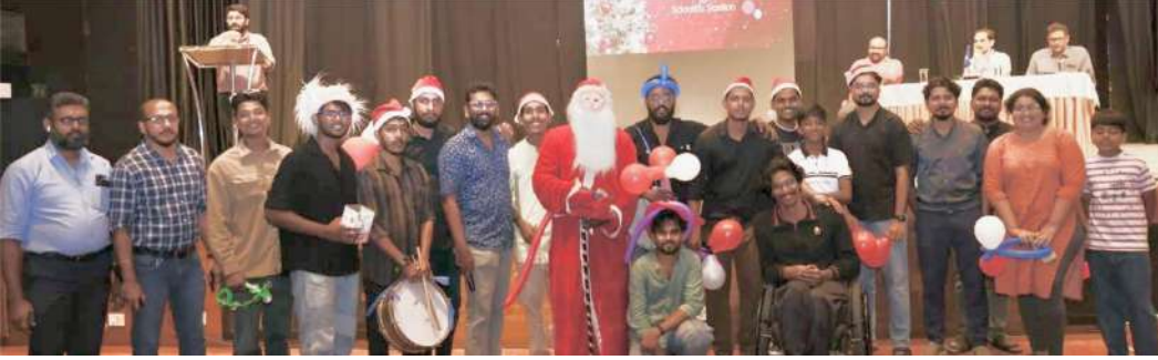
ഐ.എം.എ കൊച്ചി, അരികെ പാലിയേറ്റീവ് കെയർ എന്നിവരുടെ നേതൃത്വത്തിൽ കിടപ്പുരോഗികൾക്കൊപ്പം ക്രിസ്മസ് ആഘോഷം സംഘടിപ്പിച്ചപ്പോൾ