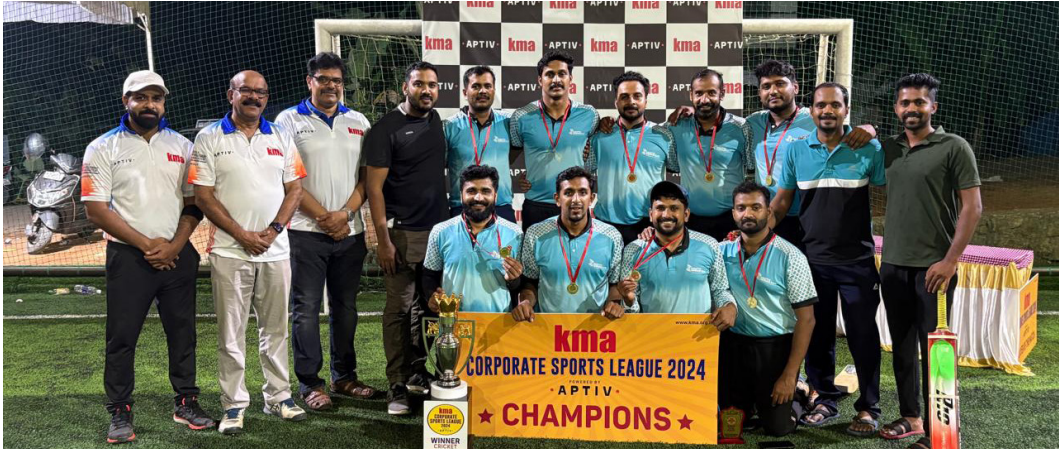
കെ എം എ സ്പോർട്സ് ലീഗിൽ ക്രിക്കറ്റ് മത്സരത്തിൽ ജേതാക്കളായ സൗത്ത് ഇന്ത്യൻ ബാങ്ക് ടീം.