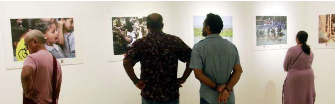
പോർട്ട് ഫോളിയോ 01 കൊച്ചി ഫോട്ടോ ജേർണലിസ്റ്റ്സ് ഫോറം എറണാകുളം ദർബാർ ഹാൾ ആർട്ട് ഗാലറിയിൽ സംഘടിപ്പിച്ച വാർത്താ ചിത്ര പ്രദർശനം 'പോർട്ട്ഫോളിയോ 2025' കാണുന്നവർ. പ്രദർശനം ഇന്ന് അവസാനിക്കും